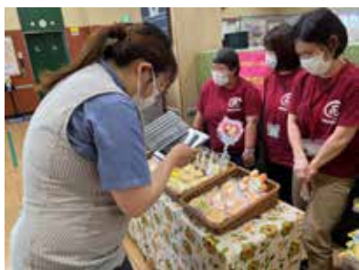
朝イチで広報の方が ツイッター用に写真撮影

花作の事を全く知らないお客さまにも、私たちのお菓子を買っていただけるととても嬉しかったです。反面、こんなにご近所でも花作を知らない人はたくさんいるんだ・・・とお菓子の宣伝は勿論、作業所活動のPRも頑張らなくてはと改めて思いました。