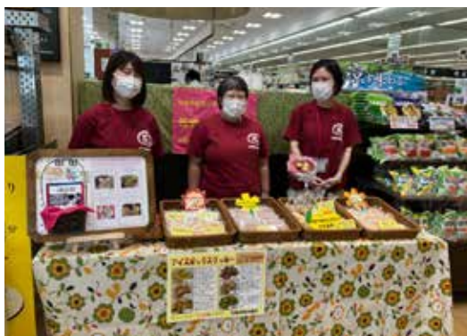
営業スマイル？ 準備万端です！

販売の様子はサミットさんのツイッターにも載せていただきました！サミットさんでも対面販売は2年ぶりだったそうです。