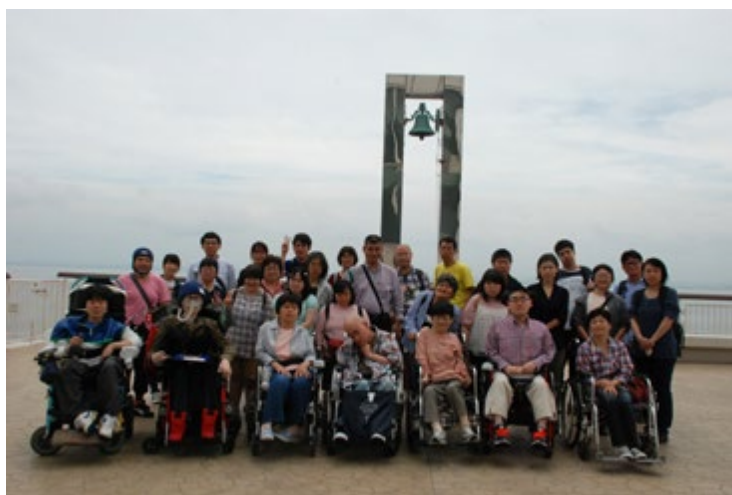
『幸せの鐘』の前で記念撮影