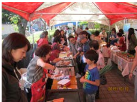
おいしい香りに誘われて～