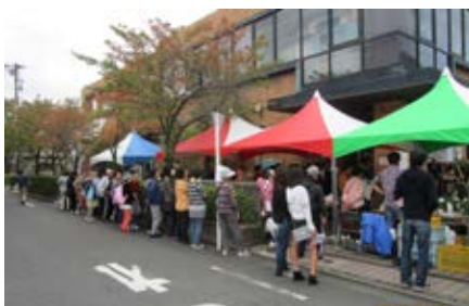
まつり直前の行列